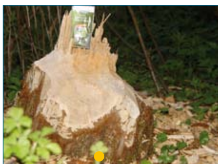
● Weide, vom Biber gefällt (Größenvergleich Tempotaschentuchpackung)