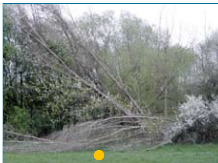
● Weide, BHD 37 cm (07.04.14)