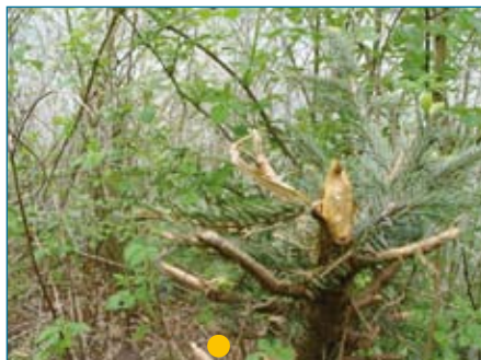
● Biberschaden an Fichten (29.04.12) an der Alz in Oberbayern

Tatsächlich war es vermutlich mehr der große Schaden, den er angerichtet hat: Man muss unterscheiden zwischen den Schäden durch die direkte Nagetätigkeit. Da ist er gegenüber uns Waldbauern gnädig, weil er sich meistens Weichlaubhölzer aussucht. Aber nicht nur: Auch die Fichte und die Tanne schmecken ihm!